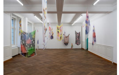
Céline Manz, 9 espaces distincts, 2020